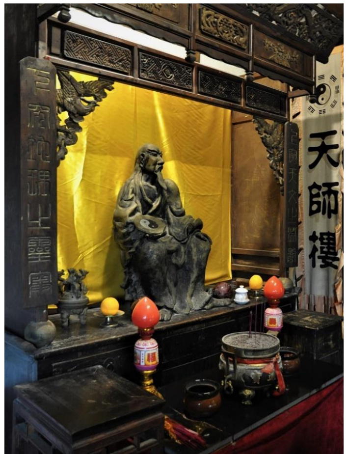
Fuxin patsas Langzhongjissa

Syntymäkuukaudesta johdetaan nk. onnenpilareit, jotka lasketaan kymmenelle vuodelle kerralla. Miehillä ja naisilla on eri laskukaavat onnenpilareille. Neljän pilarin staattisen osan muodostavat neljä pilaria ja dynaamisen osan onnen pilareit.