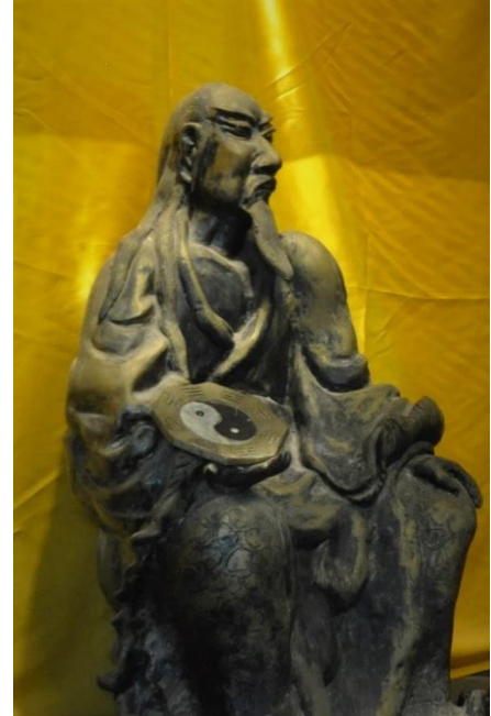
Fuxin patsas Langzhongissa

Neljä pilaria lasketaan ihmiselle syntymän vuoden, kuukauden, päivän ja kellonajan mukaan, sekä syntymäpaikan sijainnin mukaan. Neljä pilaria koostuu kahdeksasta merkistä, jotka muodostavat neljä taivaallinen runko – maallinen oksa pareja. Maallisten oksien alla on piilossa piileviä taivaallisia runkoja. Syntymäkuukaudesta johdetaan nk. onnenpilarit, jotka lasketaan kymmenelle vuodelle kerralla. Miehillä ja naisilla on eri laskukaavat onnenpilareille. Neljän pilarin staattisen osan muodostavat neljä pilaria ja dynaamisen osan onnen pilarit. Tulkinnassa huomioidaan tarvittaessa kunkin vuoden, kuukauden ja jopa päivän pilarit myös. Neljän pilarin astrologian avulla voidaan tulkita mitkä luonteenpiirteet ja taipumukset ovat vallitsevat, sekä mitkä jaksot elämässä ovat suotuisat tai haasteelliset. Kohtalon tulkitseminen on liian voimakas ilmaisu käytettäväksi neljän pilarin yhteydessä. Neljän pilarin astrologian avulla voidaan tulkita esimerkiksi ihmiselle soveltuvia ammatteja tai itseilmaisukeinoja. Neljän pilarin kartasta voi löytyä myös viitteitä ajanjaksoista, jolloin aika on suotuisa parisuhteelle, tai milloin uralla on hyvät etenemismahdollisuudet.